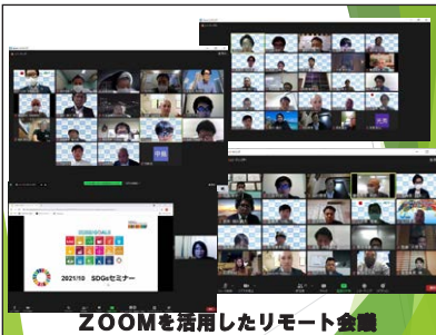
ZOOMを活用したリモート会議