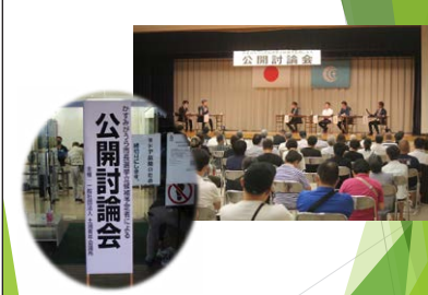
市民意識向上事業